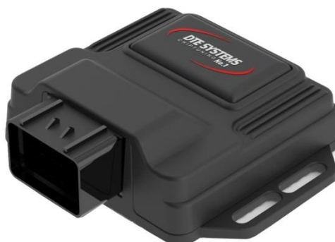
Bild des Zusatzsteuergerätes picture of the additional power control unit